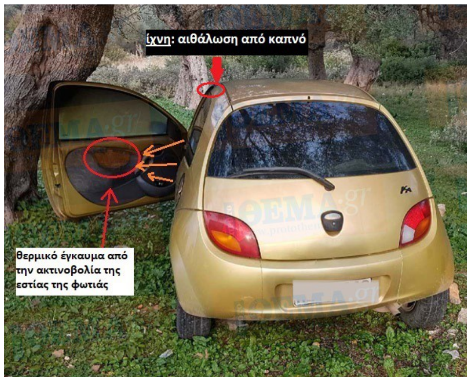
Φωτογραφίες 2 και 2α: Η αιθάλωση (ίχνος καύσης) στο αμάξωμα πάνω από την πόρτα του οδηγού