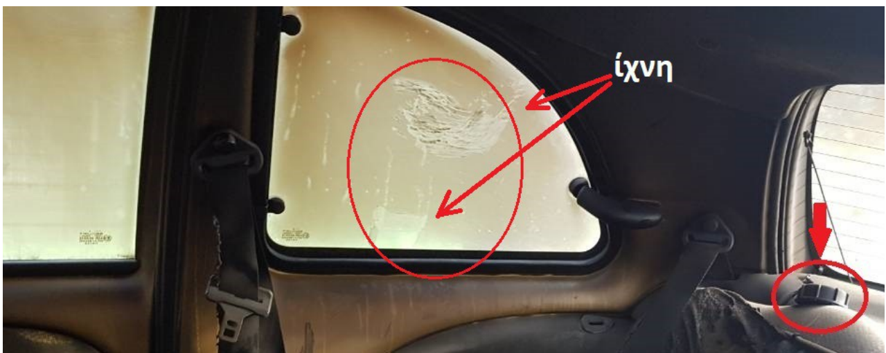
Φωτογραφίες 4 και 4α: Η ακριβής θέση του θύματος στο πίσω κάθισμα του αυτοκινήτου και τα ίχνη καύσης και πειστήρια που ανευρέθηκαν στην περίξ του σώματος περιοχής και στο παράθυρο