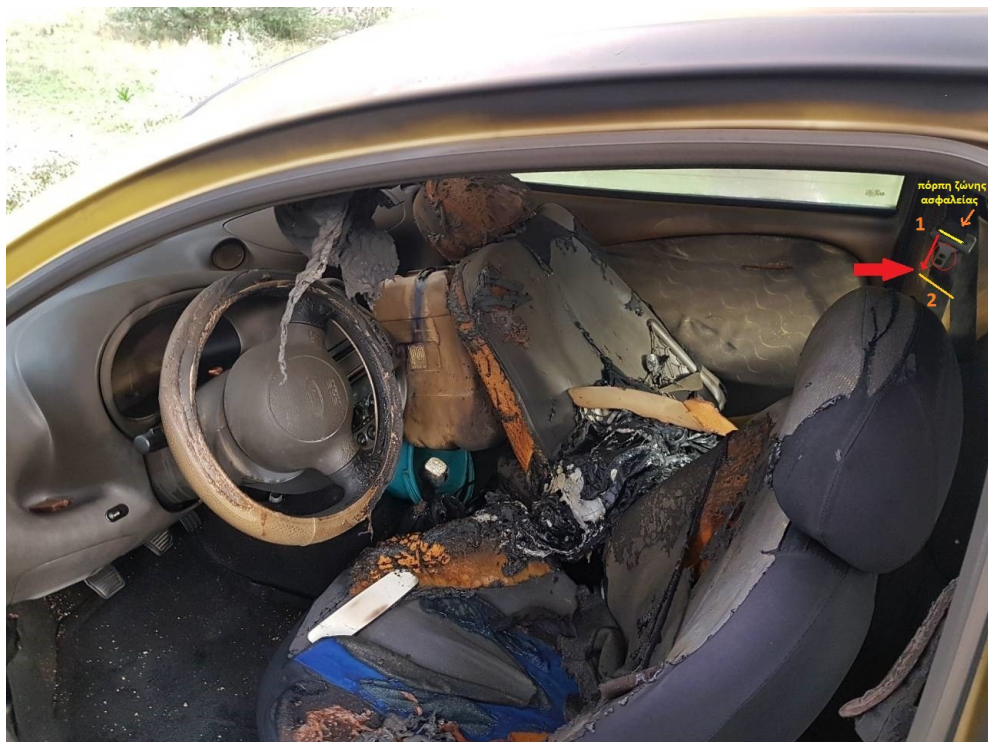
Φωτογραφίες 3 και 3α: Ο δείκτης καύσης (ίχνος) που εμφανίζεται στη ζώνη ασφαλείας του συνοδηγού.